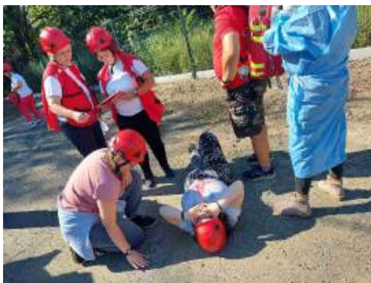
Katasztrófavédelmi felkészítés munkatársaknak.