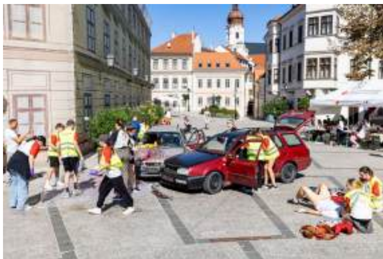
Elsősegélynyújtás Győr utcáin (Országos Elsősegélynyújtó Verseny).