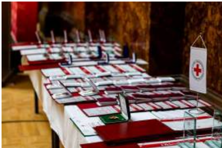
Világnapi ünnepség, elismerések.

Szintén kiemelt program volt ezévből először egy szervezetfejlesztési módszertani program, ahol a mozgalom résztvevőit hívtuk egy közös szervezetfejlesztői gondolkodásra a korábbi szervezetfejlesztési program (BOCA) önálló szervezésű folytatásaként. A résztvevők (tagok, önkéntesek, társadalmi tisztségviselők, munkatársak) a szervezet – általuk megfogalmazott kihívásairól, lehetőségeiről egyeztetett többek között az ifjúság erősítéséről, a digitális átállás szükségességéről vagy a forrásbővítés maximalizálásáról, a szervezet múltjának őrzéséről. A vármegyék önértékelő programjainak megvalósulásáról, tervezett jövőbeni programokról tartottunk egy tartalmas országos egyeztetést. Mindenképpen indokoltnak és szükségesnek tartjuk, hogy 2026.évben is értékeljük a program időarányos teljesítését.