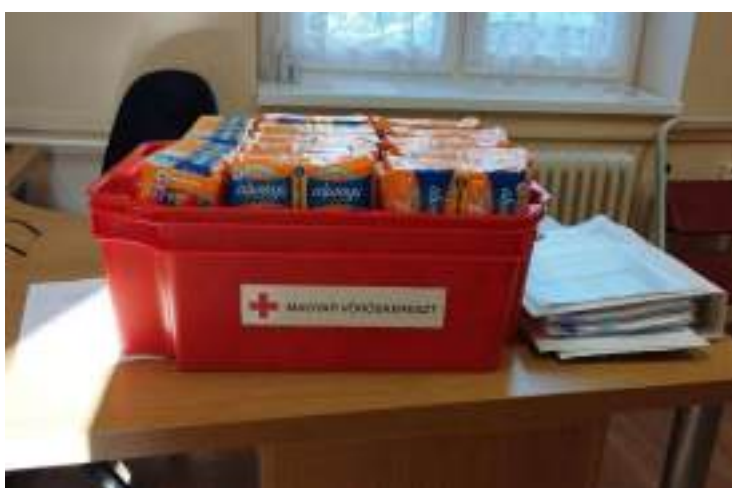
RedCrossBox az iskolában.

Az Országos Igazgatóság által koordinált, országosan kiterjesztett #lánybólnővé iskolai program május 31-én lezárult. Az őszi indítás zökkenőmentes volt, időben elindult, a nyomdai munkálatokra 1%-os felajánlások összegéből tudunk eleget tenni. Termékadományunk időre megérkezett megfelelő mennyiségben a P&G-től. Sajnos a pénzügyi helyzete a programnak továbbra sem biztató, komoly támogatót kell keresni, aki legalább két tanévre finanszírozza a vármegyei/fővárosi támogatásokat, melyek a helyben keletkezett kiadásokra elengedhetetlenek. A P&G a menstruációs szegénységgel foglalkozó programokat Európában már csak Magyarországon – nálunk- támogatja.