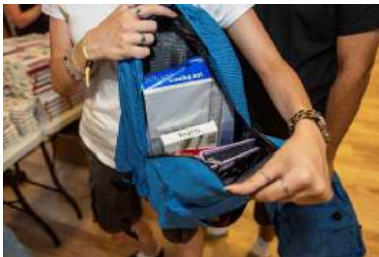
Adománycsomagolás iskolakezdésre.

A „ Jókedvvel az iskolába! ” kampány célja, hogy rászoruló gyermekek teljes felszereléssel, önbizalommal és mosollyal léphessenek be az iskolába. Partnerünk segítségével 1000 iskolaszettel megpakolt iskolatáskát állítottunk össze és osztottunk ki, emellett a helyi Vöröskeresztes szervezetek további adományokat gyűjtöttek és adtak át országszerte.