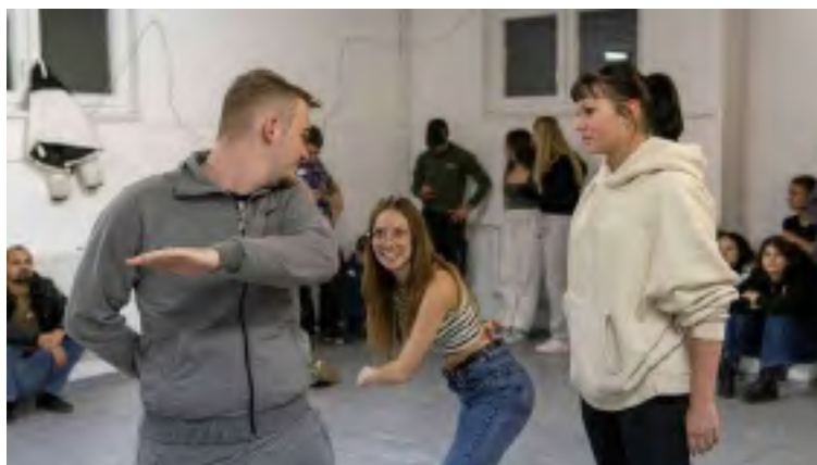
OKFT, 2025.

Az Országos Kortárs-Felkészítő Tábor (OKFT) minden évben lehetőséget nyújtott arra, hogy a fiatalok elsajátítsanak különféle ismereteket, amiket az osztálytársaiknak, csoporttársaiknak szervezett keretek között is átadhatnak a tábort követően. A tábort 2025. október 27 és 31. között rendeztük meg Szigetszentmártonon. A programon 69 ifjúsági önkéntes vett részt, melyből 8-an csoportvezetői feladatokat láttak el. A tábor több vármegyei és országos igazgatósági kolléga együttműködésével valósulhatott meg.