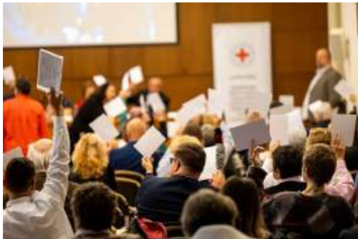
XVI. Tisztújító Közgyűlés. Fotó: Szalai Csaba.

Az Országos Vezetőség 2025. évben hat alkalommal ülésezett , figyelemmel kísérve a szervezet munkáját, a humanitárius krízisből eredő, valamint a jogszabályi változásokból eredő kihívásait. Szakmai tevékenységünket segítették az Országos Vezetőség által létrehozott munkabizottságok (Jogi- és Alapszabályügyi; Mozgalmi- és Ifjúsági; Szociális; Elsősegélynyújtási; Vértáplásszervezési; Katasztrófavédelmi; Egészségfejlesztés - és Mentálhigiénés, Jótékonyági; Nemzetközi; Ingatlanfejlesztési), melyek az év során üléstervüknek megfelelően konzultáltak, programtervük szerint végezték munkájukat.