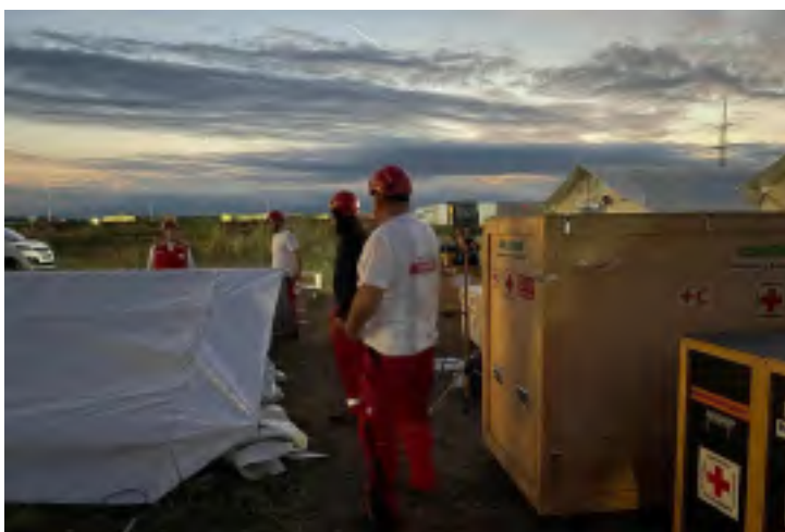
EU MODEX.

A Red Cross EU Office és a DG ECHO tovább folytatta a együttműködést, melynek célja, hogy közös fórumokon dolgozzanak ki a nemzeti társaságok és a polgári védelem bevonásával a lakosság felkészítését célzó szakmai anyagokat. A munkacsoportban a francia, magyar, német, osztrák és spanyol Vöröskereszt katasztrófavédelmi szakmai munkatársai vesznek részt.