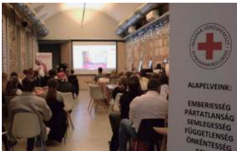
Szakmai beszámolók az önkéntesség világnapján.

2025. december 5-én, az önkéntesek világnapja alkalmából a Magyar Vöröskereszt különleges eseményt szervezett az Empathy közösségi tér helyszínünkön. A program szakmai előadásokkal és önkéntes beszámolókkal várta az érdeklődőket. Emellett bemutatkozott a H-HERO (Hungarian Healthcare in Emergency Response Operations), katasztrófaelhárítási műveletek során egészségügyi szolgáltatást nyújtó csapata is, amely a Magyar Vöröskereszt katasztrófákra való felkészülésében játszik kiemelkedő szerepet. A csapat tagjai személyes tapasztalataikon és motivációikon keresztül adtak betekintést a munkájukba.