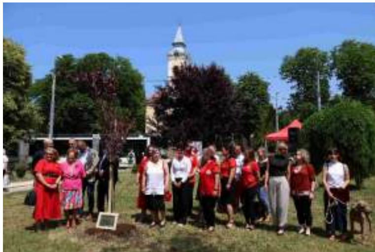
Véradók fája ültetés.

2025. június 14-én, Miskolcon elültették a Véradók fáját, mely már 6 volt a sorban. Ebben az évben egy Vérszilvafa csemete lett a véradás fontosságának szimbóluma, melyet Miskolc alpolgármestere, a Magyar Vöröskereszt vezetői és a vármegye igazgatója ültetett el.