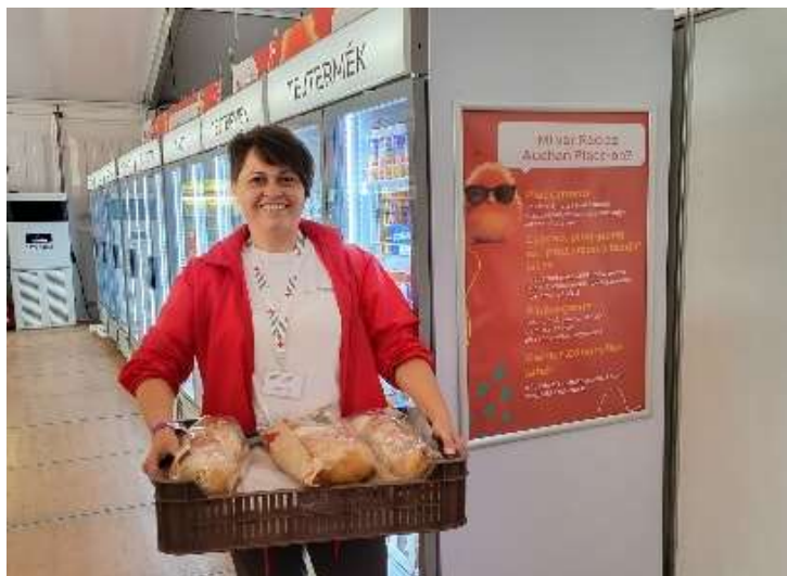
Pékárúk megmentése.

szerepet játszanak az önkéntesek, valamint az önkormányzatokkal és szociális intézményekkel kialakított együttműködések.