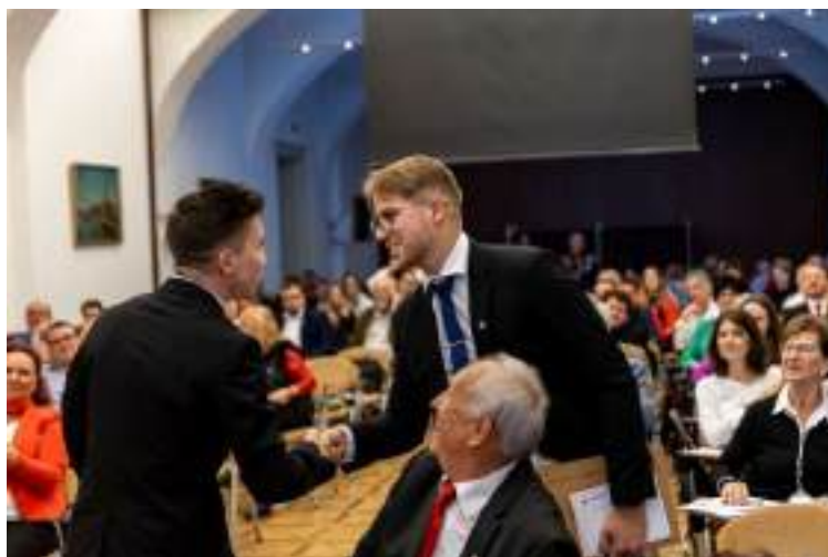
Tisztújító Kongresszus.

elnökének Berezki Mátét, Budapest fővárosi ifjúsági elnököt választották. Az OIV taglétszáma 18 fő. Több vármegyéből hiányzik a képviselő.