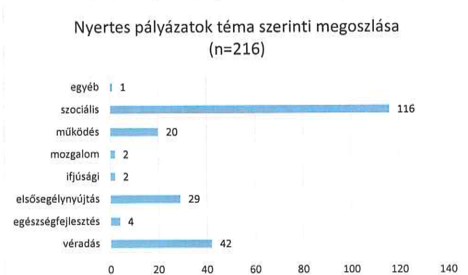
7. ábra: Nyertes pályázatok téma szerint, 2021