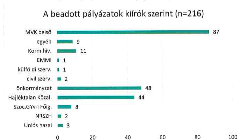
8. ábra: Nyertes pályázatok a benyújtás helye szerint, 2021