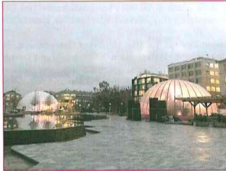
Mikulás Gyár – 2019. december

Mikulásgyár fő gyűjtőhelyszíne ismét a Millenáris Parkban volt, emellett Budapesten a Lurdyházban és a József Attila Színház aulájában is fogadták a gyerekeknek szánt adományokat. A rendezvénysorozat és adománygyűjtés november 29 – december 21-ig tartott. A gyűjtés eredményeképp csaknem 132 tonna adomány érkezett, melyből közel 28 tonna ruhanemű és cipő, 42 tonna élelmiszer. Ezeken kívül a játékok és könyvek (34,5 tonna) tették ki a legjelentősebb mennyiséget. Vidéken a Magyar Posta juttatta el a felajánlásokat a helyi szervezeteinkhez. A beérkezett felajánlásokat 236 vöröskeresztes munkatárs és 1.058 önkéntes dolgozta fel 8.841 órában. Közel 16.000 gyermeket és családjaikat részesítettük ajándékban és kaptak élelmiszert is a lakossági és céges felajánlásokból karácsonyt megelőzően.